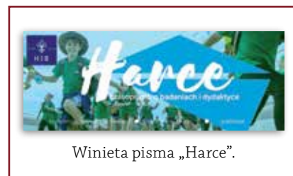
Winieta pisma „Harce”.