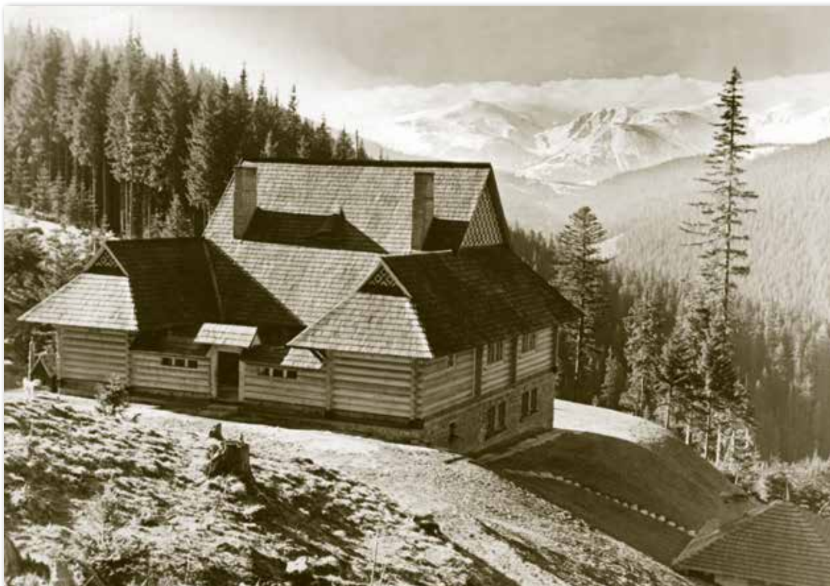
Schronisko na Kostrzycy. W lewym rogu buda dla psa. Na prawo, w dole, budynek agregatu prądowłórczego.