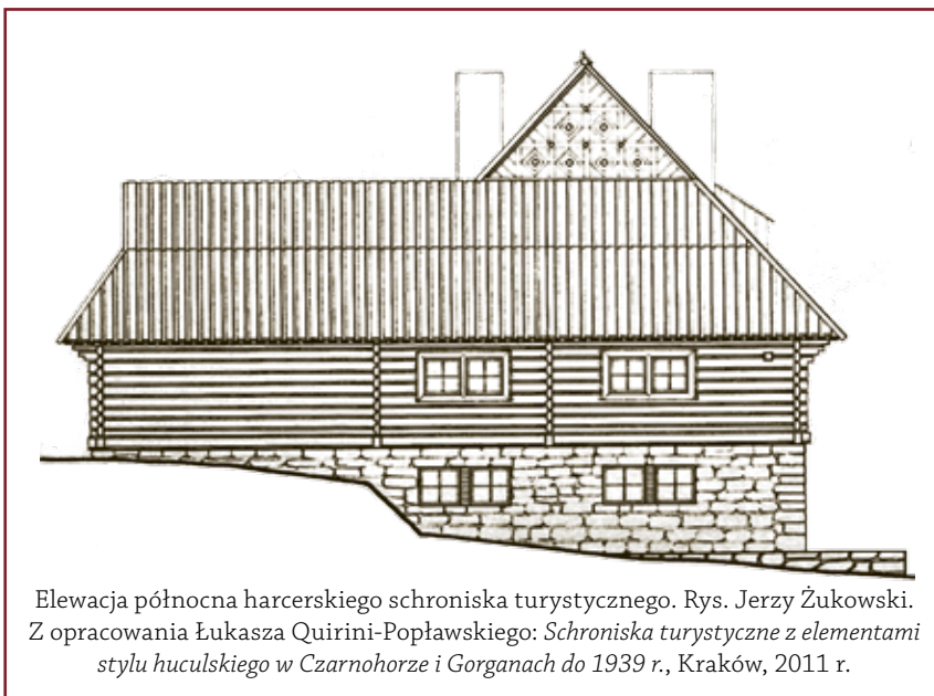
Elewacja północna harcerskiego schroniska turystycznego. Rys. Jerzy Żukowski. Z opracowania Łukasza Quirini-Popławskiego: Schroniska turystyczne z elementami stylu huculskiego w Czarnohorze i Gorganach do 1939 r. , Kraków, 2011 r.

wytrawersowanie kilku szlaków w okolicy schroniska 9 .