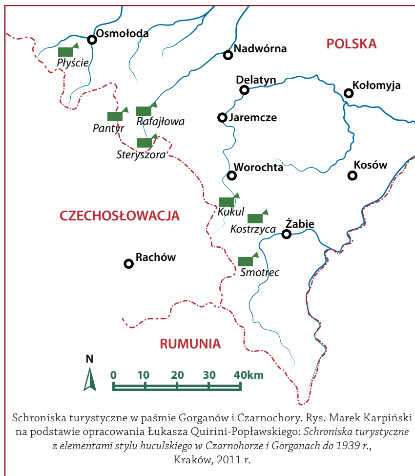
Schroniska turystyczne w paśmie Gorganów i Czarnochory. Rys. Marek Karpiński na podstawie opracowania Łukasza Quirini-Popławskiego: Schroniska turystyczne z elementami stylu huculskiego w Czarnohorze i Gorganach do 1939 r. , Kraków, 2011 r.

nasilenia prac budowlanych 20 koni, obciążone sześćdziesięcioma kilogramami ładunku, robiło 4 tury dziennie. Wielkim wyzwaniem było dostarczenie na budowę żelaznego zbiornika na wodę o wadze 400 kg i niewiele lżejszego agregatu. Transport materiałów budowlanych wyniósł 21% całkowitego kosztu budowy. Wszelkie prace budowlane wykonali okoliczni huculi. Kubatura obiektu wynosiła 1310 m 3 i ok. 400 m 2 powierzchni użytkowej. Budowę zakończono 15 października, po 254 dniach roboczych 5 .