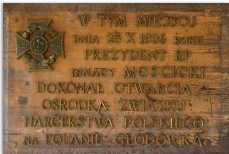
Tablica pamiątkowa. Fot. L. Dall, 2020 r.

w domu artystów p. Prezydent, żegnany owacyjnie, odjechał z powrotem do swej siedziby.