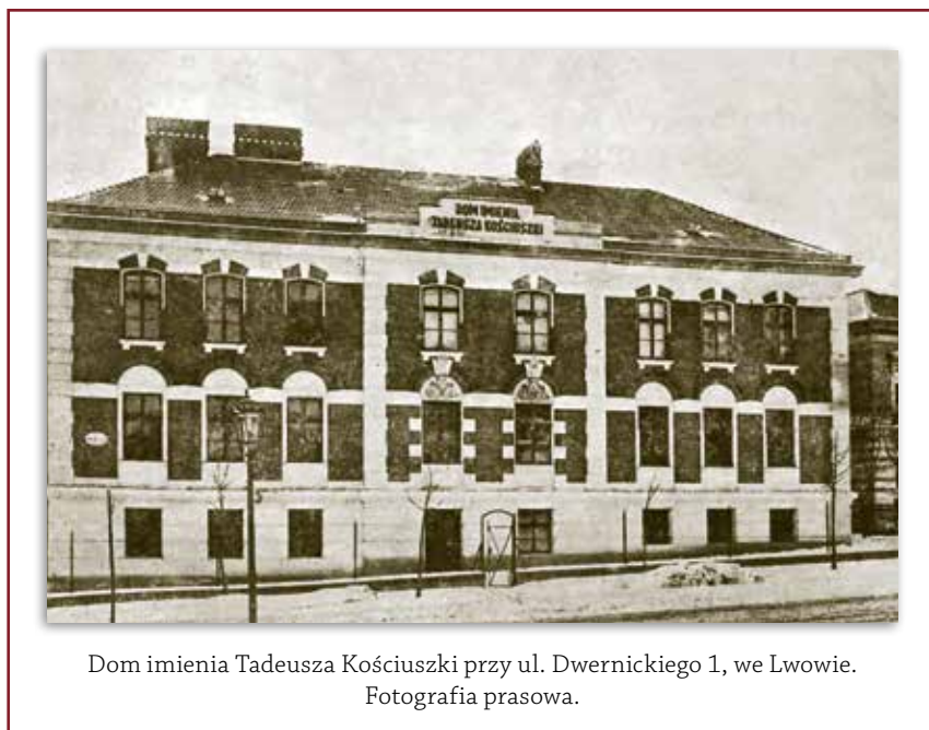
Dom imienia Tadeusza Kościuszki przy ul. Dwernickiego 1, we Lwowie. Fotografia prasowa.