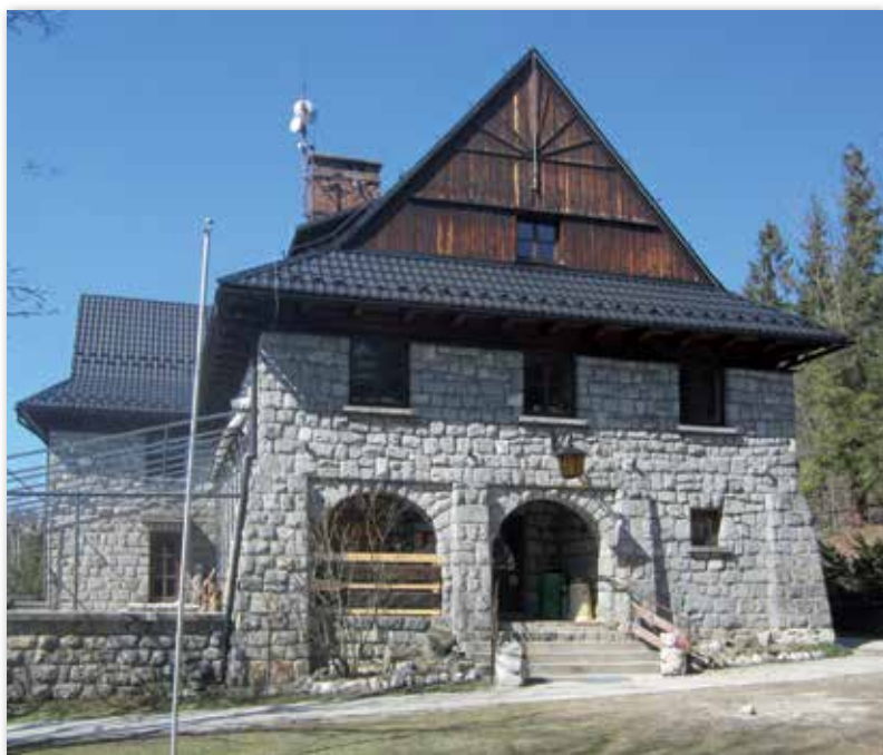
Schronisko ZHP na Głodówce. 2020 r.