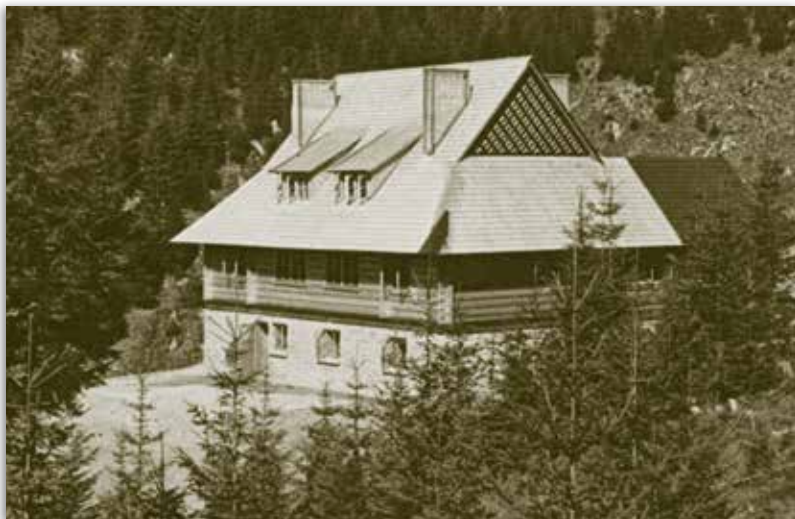
Schronisko na Kostrzycy.