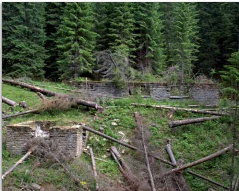
Ruiny schroniska na Kostrzycy. Fot. Łukasz Quirini-Popławski, 2008 r.

1936 roku zorganizowano 7 kursów narciarskich – 4 Harcerskiego Klubu Narciarskiego z Warszawy i 3 oficerskie dla podporuczników warszawskiego i łódzkiego Dowództwa Okręgu Korpusu 18 . Ostatni narciarski kurs oficerski odbył się w styczniu 1939 roku przy całkowitym braku śniegu.