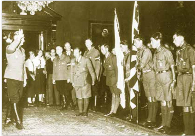
Członkowie delegacji japońskich skautów na spotkaniu z Baldurem von Schirach, Niemcy, Brema, sierpień 1937 r.