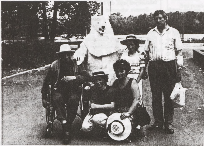
Na wycieczce w Chorzowie (16 IV 1991 r.)

Zajęty działaniami organizatorskimi mało pisał a to wielka szkoda. Pozostawił kilka opracowań o Wojniczu: "Ważne daty z historii Wojnicza" i "Wojnickie legendy".