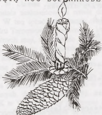
Wiersz i rysunek Zyty Roman

I będziesz otuchy mi dodawała W ŚWIĘTĄ NOC BOŻONARODZENIOWĄ!