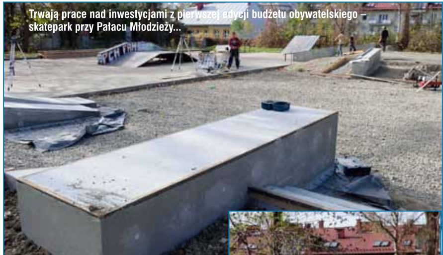
Trwają prace nad inwestycjami z pierwszej edycji budżetu obywatelskiego – skatepark przy Pałacu Młodzieży...