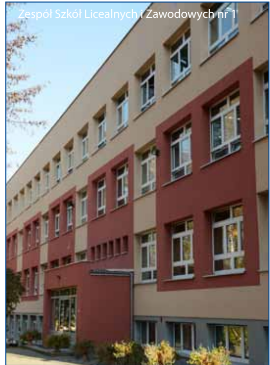
Zespół Szkół Licealnych i Zawodowych nr 1

Termomodernizacja możliwa jest dzięki dofinansowaniu i preferencyjnej pożyczce otrzymanej z Narodowego Funduszu Ochrony Środowiska i Gospodarki Wodnej oraz dofinansowaniu z Małopolskiego Regionalnego Programu Operacyjnego. Jej koszt w tym roku to prawie sześć mln zł. W sumie termomodernizacja obiektów oświatowych w latach 2010-13 objęła ponad 40 placówek (1 dom dziecka, 2 domy pomocy społecznej, 5 żłobków, 11 przedszkoli oraz 22 szkoły). Kosztowała prawie 29 mln zł.