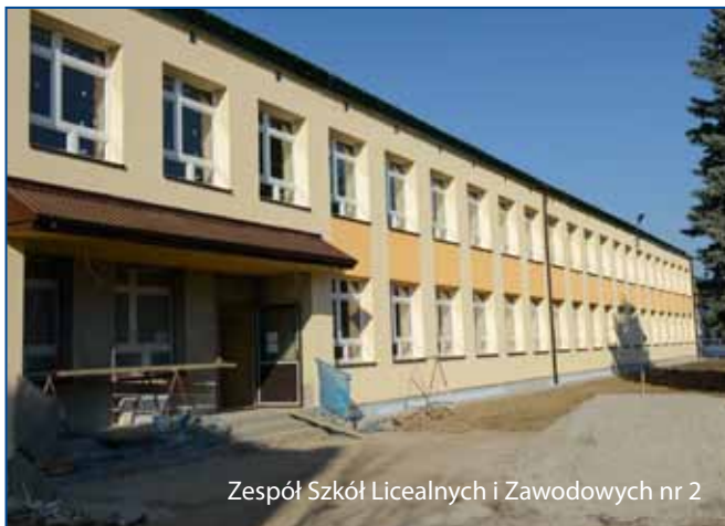
Zespół Szkół Licealnych i Zawodowych nr 2