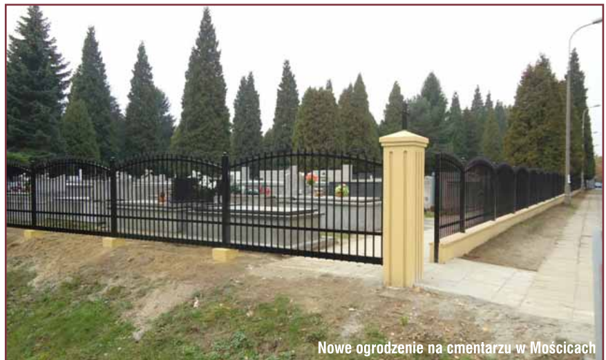
Nowe ogrodzenie na cmentarzu w Mościcach

Ważną tegoroczną inwestycją jest projekt elektronicznej inwentaryzacji osób pochowanych na wszystkich cmentarzach komunalnych w Tarnowie. Pierwsza faza projektu, która została oddana do użytku 1 listopada, zawiera dane z tablic epitafijnych znajdujących się na wszystkich grobach na Cmentarzu Starym. Stopniowo baza danych będzie aktualizowana i uzupełniana o kolejne miejskie cmentarze. - Wprowadzenie systemu nie tylko usprawni zarządzanie danymi, ale pozwoli również na uruchomienie internetowej wyszukiwarki osób pochowanych GROBONET. Umożliwi ona zainteresowanym osobom odnalezienie grobów, w których pochowani zostali ich bliscy – podsumowuje dyrektor Wójcik.