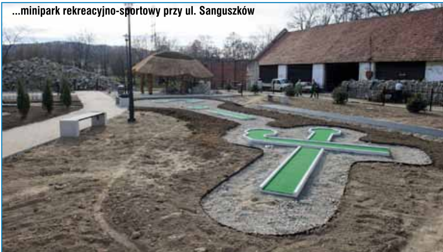
...minipark rekreacyjno-sportowy przy ul. Sanguszków