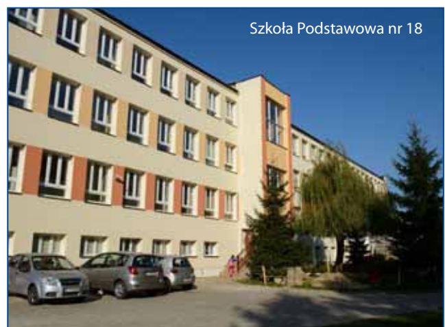
Szkoła Podstawowa nr 18