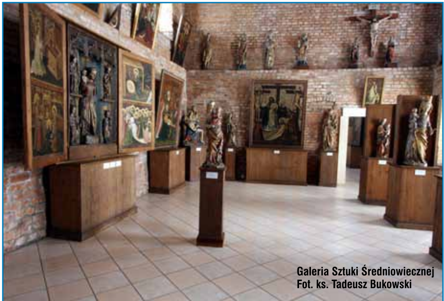
Galeria Sztuki Średniowiecznej

Tarnowskie Muzeum posiada także dział sztuki ludowej, gdzie na szczególną uwagę zasługują obrazy ludowe malowa-