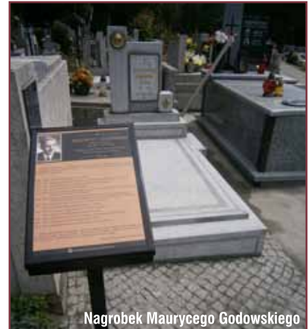
Nagrobek Maurycyego Godowskiego

Jak podkreśla dyrektor MZC, ważną częścią tegorocznych inwestycji były prace przy zabytkowych nagrobkach. Na Cmentarzu Starym poddano renowacji dziewięć tablic epitafijnych z początku XIX wieku, które umieszczone są na murze cmenta-