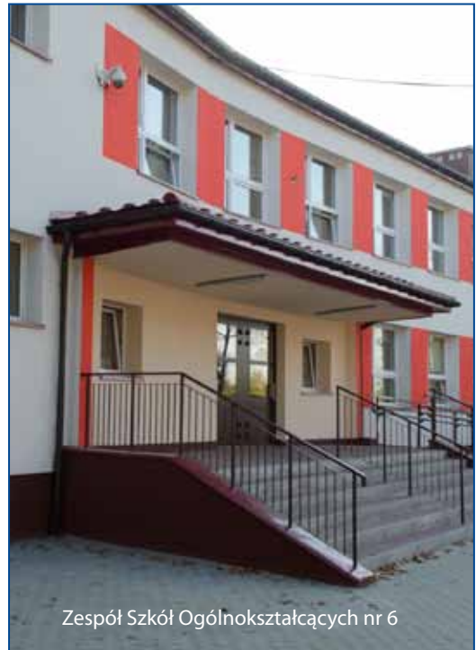
Zespół Szkół Ogólnokształcących nr 6