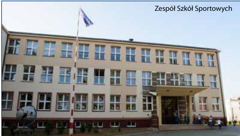
Zespół Szkół Sportowych

Dobiegają końca zaplanowane na ten rok prace termomodernizacyjne w tarnowskich placówkach oświatowych. To ostatni etap dużego miejskiego programu, którego celem jest podniesienie estetyki i funkcjonalności żłobków, szkół, przedszkoli i domów pomocy społecznej.